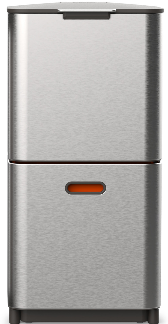
Totem Max (60L)