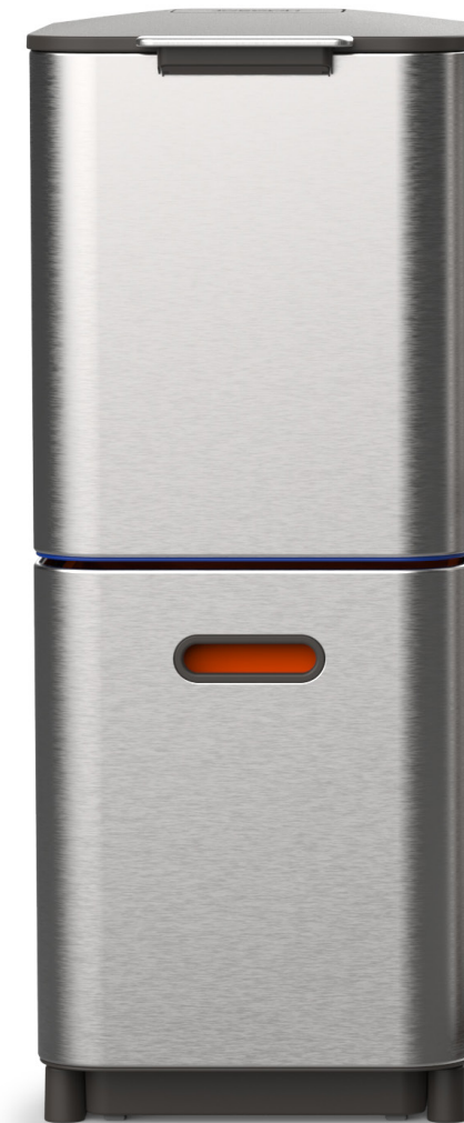
Totem Compact (40L)